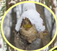
山菜の王様 コンアブラと タラノメ