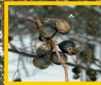
タンアサワフタギ